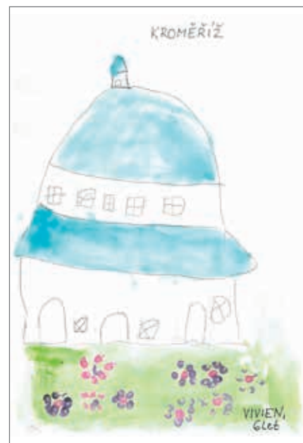
Kroměříž, Vivien, 6 let