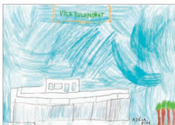
Vila Tugendhat, Adéla, 8 let