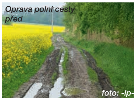
Oprava polní cesty před