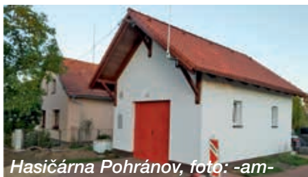
Hasičárna Pohránov