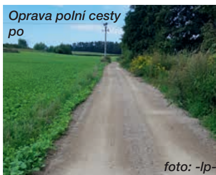
Oprava polní cesty po