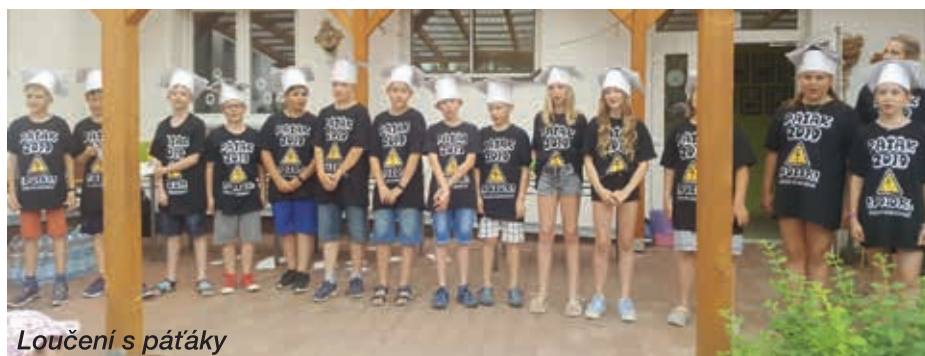
Loučení s pátáky