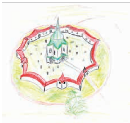
Zelená Hora, Ondra, 15 let