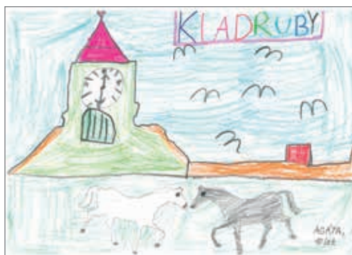
Kladruby, Agáta, 10 let