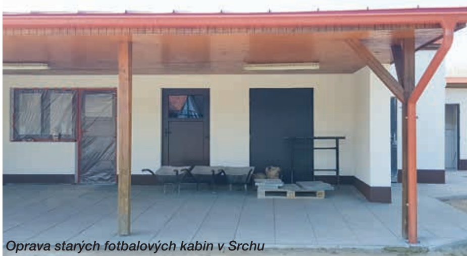
Oprava starých fotbalových kabin v Srchu