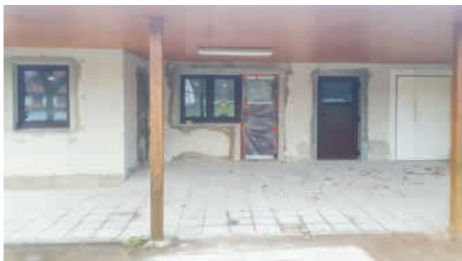
Oprava starých fotbalových kabin v Srchu

od přechodu přes horkovod směrem k rybníku „Baroch“ v délce cca 1 km. Jedná se o část cesty směrem na Kunětickou horu, jak bylo popsáno v minulém čísle Zpravodaje. O dalších investicích v roce 2019 budeme informovat v dalším čísle.