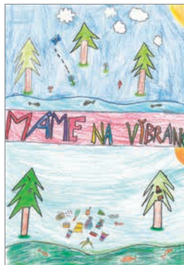
Viktorie Koukalová (3. roč.), Tereza Drbalová (2. roč.), Terezie Cetkovská (3. roč.), Agáta Fejfarová (4. roč.), Eliška Sýkorová (2. roč.)