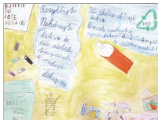
Kristýna Sykáčková, Denisa Filipi (2. roč.)