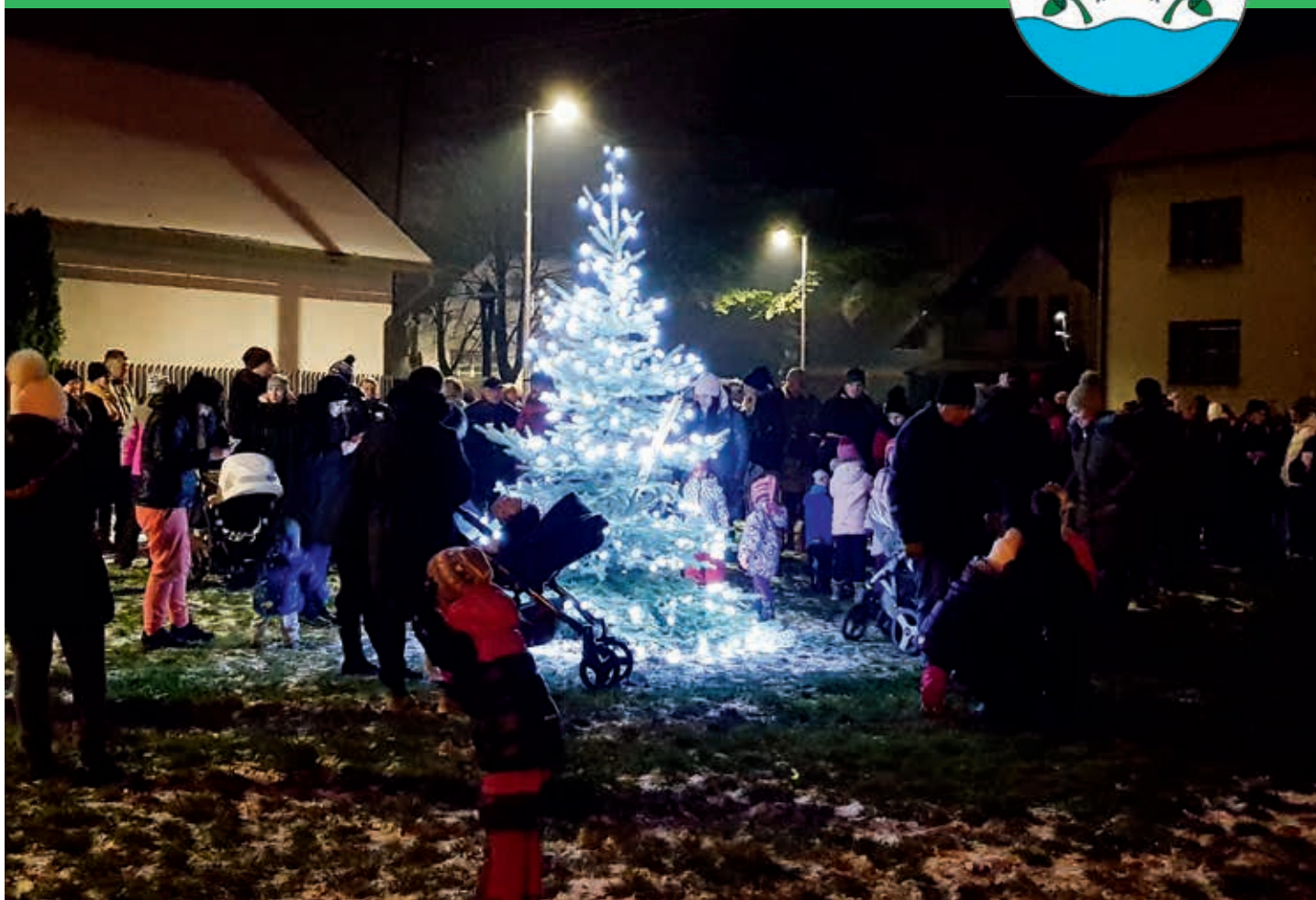
Rozsvícení vánočního stromu