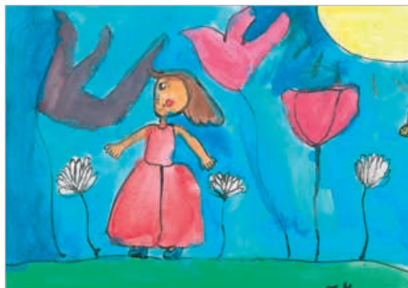
Tereza Kadlecová, 2. ročník