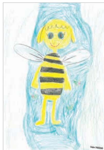
Kristýna Sykáčková, 1. ročník