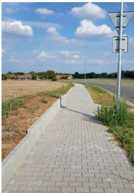
Chodník Pohránov

V červnu byly vybudovány chodníky na hřbitově v Hrádku. O prázdninách proběhly ještě terénní a dokončovací práce kolem hrobů. Jak se stalo již tradicí, někomu se realizace líbí, někomu ne, někdo by chodníky nerealizoval vůbec. Každému se nezavděčíme, to je v pořádku.