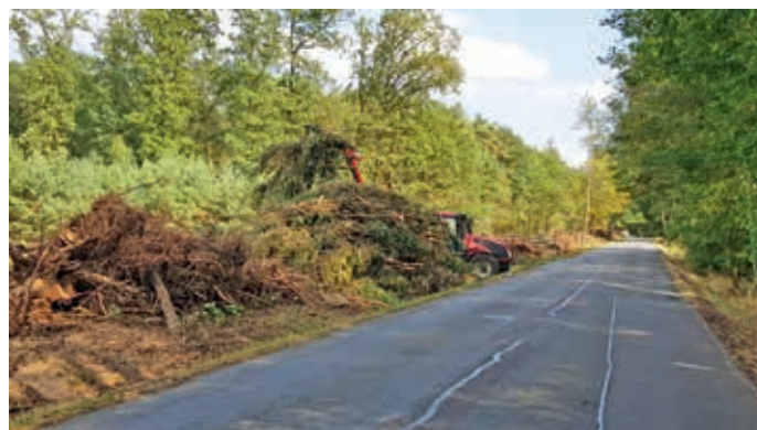
Příprava cyklostezky