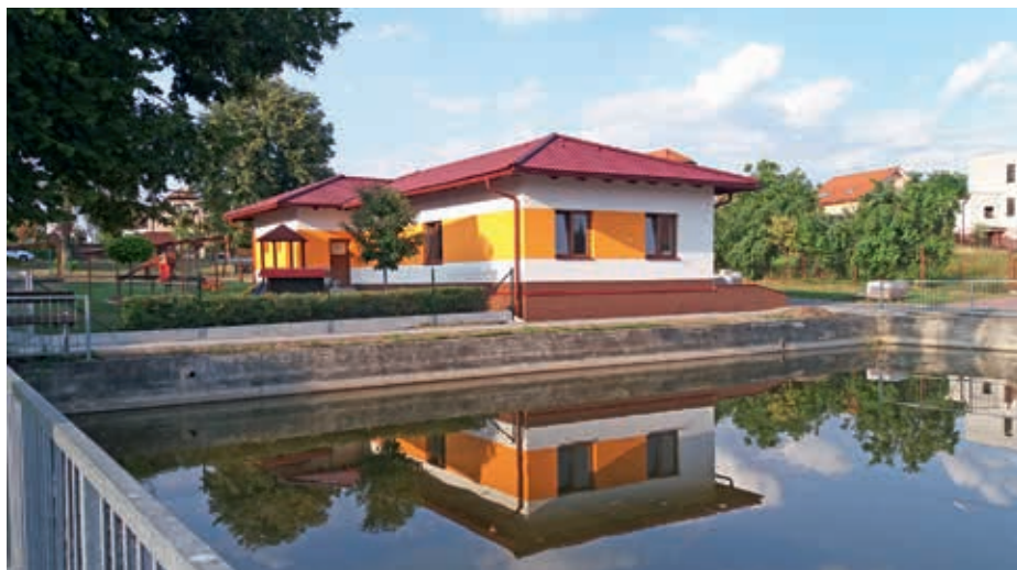
Garáž komunální techniky

novanou investici, a sice instalaci betonových zábrán a související prodloužení chodníku v Hrádku u ostré pravotočivé zatáčky ve směru od Pohránova. Úsek je nebezpečný pro chodce, protože automobily ve směru od Dolan mají často problém v zatáčce dobrzdit. -lp-