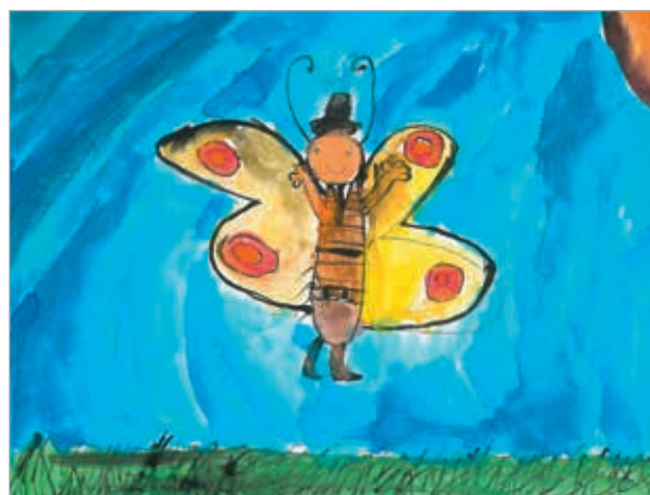
Terezie Cetkovská, 2. ročník