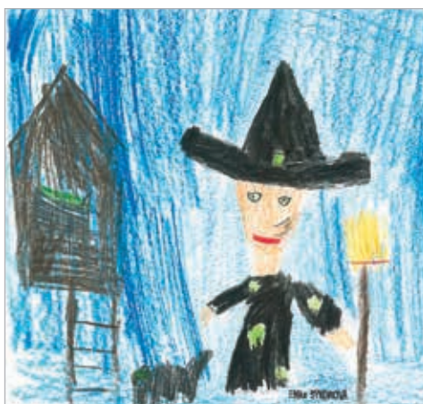
Eliška Sýkorová, 1. ročník