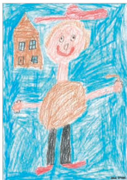
Jakub Šprinc, 1. ročník