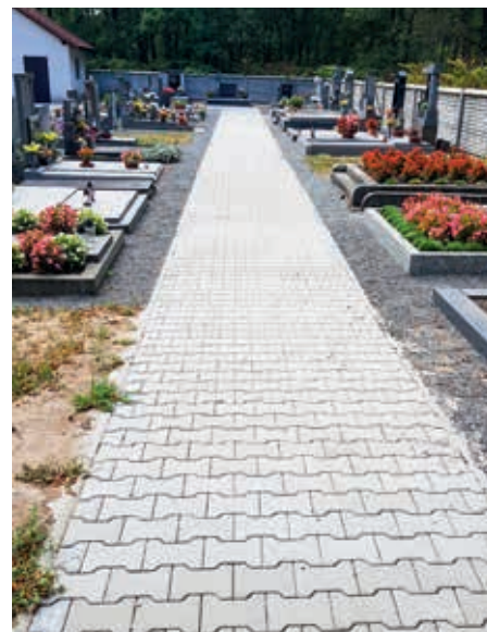
Chodník na hřbitově v Hrádku

Mezi drobnější investice bude patřit oprava hasičáren v Hrádku a v Pohránově. Také chceme stihnout jednu neplá-