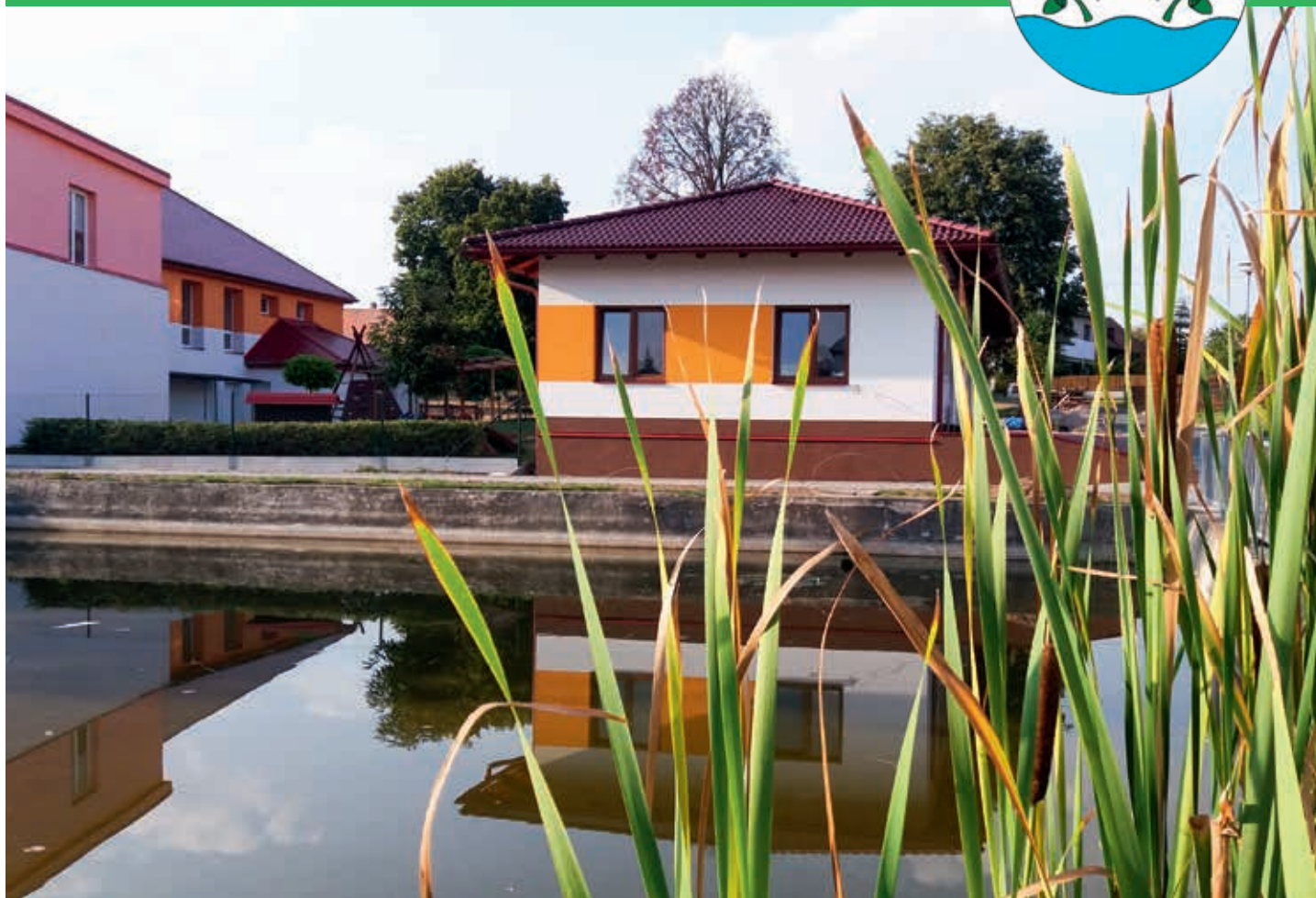
Garáž komunální techniky v Srchu